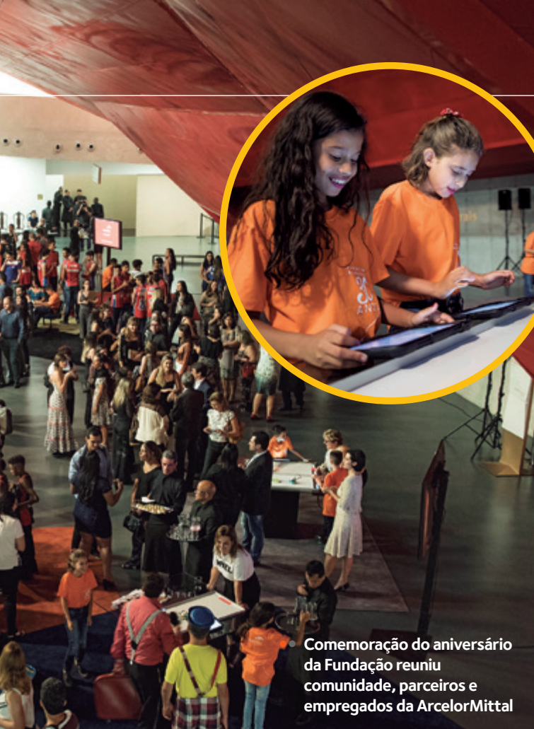
Comemoração do aniversário da Fundação reuniu comunidade, parceiros e empregados da ArcelorMittal